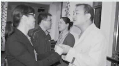
我们彼此再一次在神面前立约