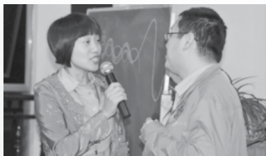
我们一起唱起那最美的诗歌