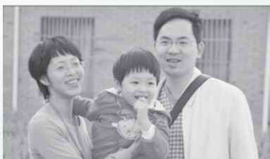
一起享受在主爱中的幸福和家庭的美满