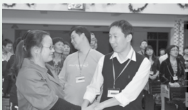
我们一起眼看着眼