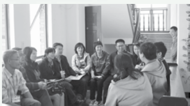
一起在团契中分享交通