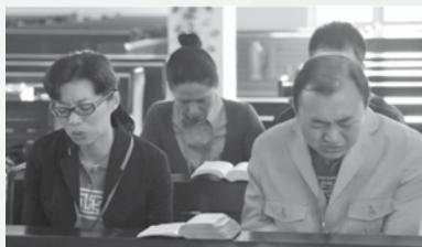
一起在神的圣殿中祈祷