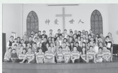
我们在基督里是一家人