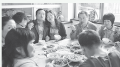
一起在教会中享受上帝的预备的美食