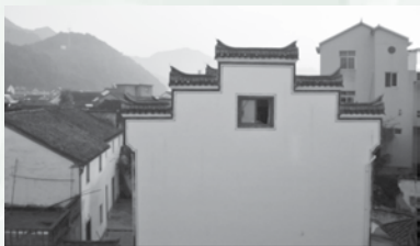
在这紧张的3天中，我们一起在清晨起来朝见神

在这次婚姻辅导的3天的课程中，我们一起敬拜，一起赞美，一起欢笑，一起落泪，一起祷告，一起服侍。让我们真经历到神在我们身上奇妙的改变。