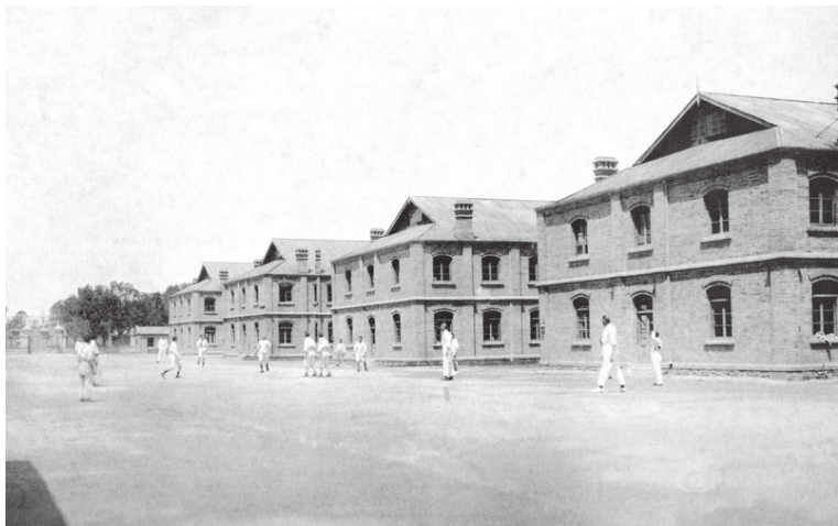
30年代教会大学上海圣约翰大学在学生中开展的足球运动

在清朝后期，伴随着基督教福音的传布，西方传教士也将现代竞技体育运动逐渐引入中国，对促进体育运动在中国的发展起着积极的推进作用。解放前，旧中国从1910年到1948年共举办了七届全国运动会，其中最早的两届为基督教所举办。基督教在全国各地传布福音时，为了扩大基督教的影响，为了使基督教深入人心，除建立学校、医院、痲病痲风疗养院等外，还大力开展百姓喜闻乐见的体育运动。特别是现代体育运动对于易于接受新鲜事物的年轻人，更具吸引力和竞争力，由于有一定的竞技运动如足球、篮球、网球、田径等为基础，因此促成了由西方欧美基督教世界青年会干事创导和主持举办最初的两届全国运动会。