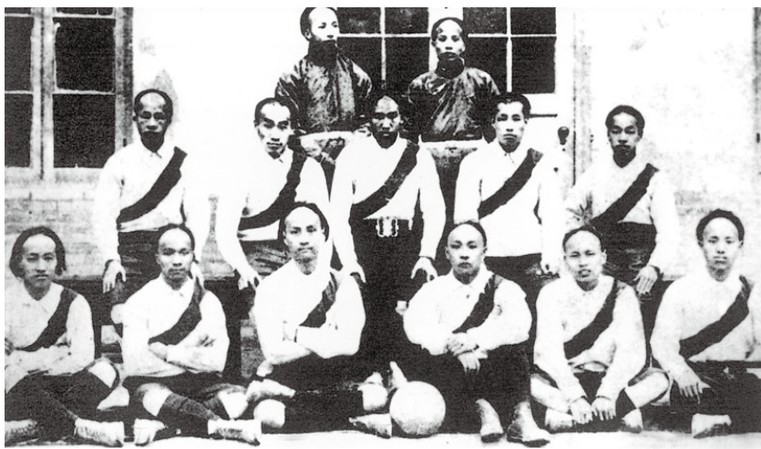
清朝晚期在中国大地上已开始开展拖着长辫的足球运动员竞赛的身影， 图为当时已有十一人制足球队，为了运动方便将长辫盘在头上。

在现代竞技体育运动的发展中，不能否认，基督教的传入也带来了西方的现代体育运动的竞技项目，对现代体育运动的开展和发展起着积极的推动作用，从史料上看到，如北京的燕京大学、南京的金陵大学、上海的沪江大学、圣约翰大学、杭州之江大学、齐鲁大学、广岭南大学、华西协和大学等，在教会学校的发展中都离不开现代体育运动的开展，并且运动水平也很高，往往是所在城市夺标者。很多现代体育运动竞技项目是从教会大学中最先开始的，如杭州教会大学之江大学最早开展足球、篮球、网球、羽毛球、乒乓球与田径运动。上述教会大学中开展现代体育运动都是非常积极，对所在城市的体育运动开展起着积极的推动作用，从保存的老照片上清楚看到当时拖着长辫子的足球运动员留影。